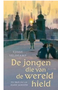
De jongen die van de wereld hield Tjibbe Veldkamp